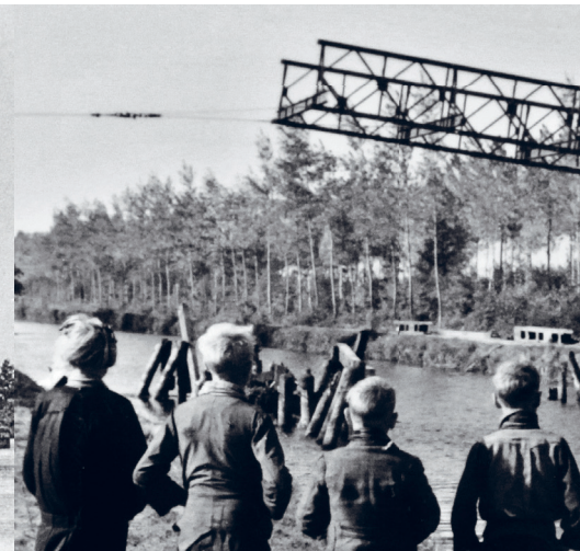
Bouw van de Bailey-brug in Ravels.