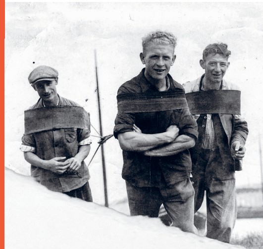
Vaartketers die de schepen trokken.

Meer weten over de vaART ? Ontdek het volledig verhaal via de gratis app izi.travel, route: vaART