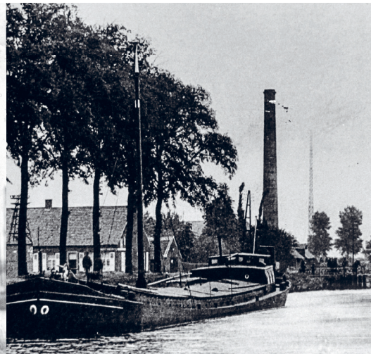
Vrachtschepen en steenbakkerijen te Beerse.

de vaART, een samenwerking van de gemeentes Dessel, Retie, Arendonk, Ravels, Oud-Turnhout, stad Turnhout, Beerse, Rijkvorsel, Brecht en Schoten. Met de steun en medewerking van Erfgoed Noorderkempen, k.ERF en de Vlaamse Waterweg nv. Gamma zorgde voor de kleurrijke buitenverf.