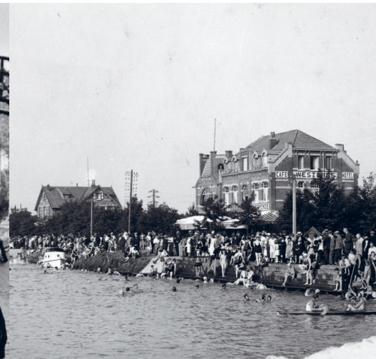
De Hotels Wenduine en Westende in Schotenbad.