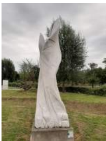
Onberispte natuur (Medardo Maseroli)

Als kind leerde ze van haar vader dat enkel schoonheid de wereld kan redden en in stand houden. Die levensles is nu haar eigen motto. Daarom koos ze voor een loopbaan als kunstenares. Voor Chinezen betekent kunst schoonheid, ze noemen het daarom schone kunsten. Haar beeld met het hert in een frame van speelkaarten beelden 800 jaar stadsrechten uit.