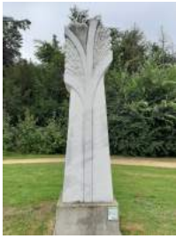
Levensboom (Willy Roothoofd)

Willy Roothoofd volgde publiciteit en grafische vormgeving in Heist-op-den-Berg. Zijn beelden zijn gegroeid uit de communicatie tussen beeldhouwer en steen. Bij deze opdracht heeft Willy zich laten inspireren door het thema 'zandland-randland': de zandige heide waar de landbouwers creatief en vindingrijk moesten zijn voor de bemesting van de zandgronden en het laten grazen van de schapen. De strijd tussen mens en natuur is een kwestie van overleven. Vandaar het idee om een levensboom te ontwerpen met bovenaan een gestileerde levensrune welke uitmondt in een soort bloem met bijhorende vrucht.